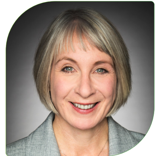
L'HONORABLE PATTY HAJDU C.P., députée Ministre de la Santé

Le Canada fait face à de nombreux défis sur le plan de la santé, et ce sont souvent les membres les plus vulnérables de notre société qui en font les frais. En investissant dans la recherche aujourd'hui, nous générerons les connaissances nécessaires pour trouver des solutions durables et factuelles qui profiteront à tous, au pays et ailleurs dans le monde. Au nom du gouvernement du Canada, j'invite les Canadiennes et les Canadiens à lire le présent plan stratégique pour en apprendre davantage sur les IRSC et leur vision, qui améliorera notre santé aujourd'hui et celle des générations à venir.